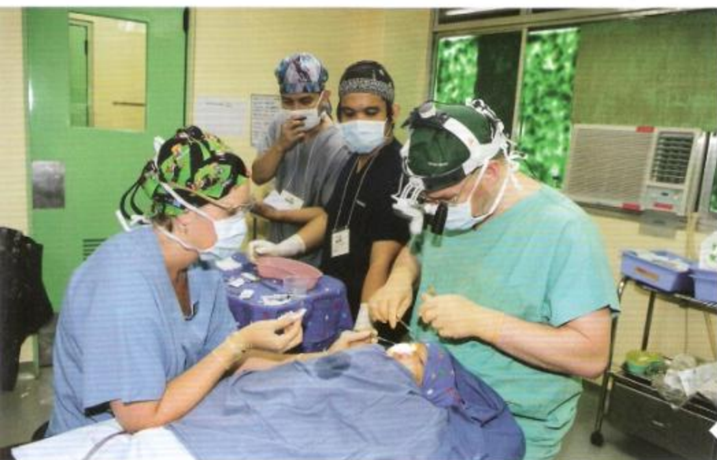
Operation: Der Eingriff dauert zwischen 45 Minuten und 3,5 Stunden.

Wie ein Lauffeuer verbreitet sich die Nachricht von der bevorstehenden Ankunft der Hilfskräfte in den Armenvierteln. Bereits zwei Monate